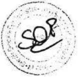
..... SYLVIA E. CÁCERES PIZARRO Ministra de Trabajo y Promoción del Empleo